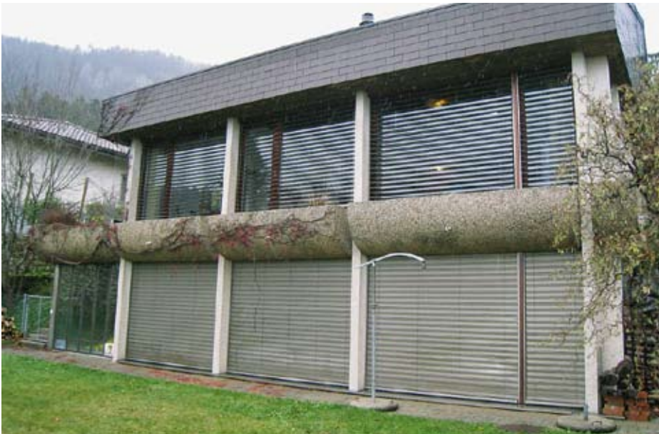
Die passive Nutzung der Sonnenenergie (nach Süden orientierte Fenster) wird im Gebäudeenergieausweis berücksichtigt.