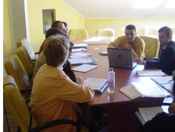
Dialog ist eine der Voraussetzungen für das Gelingen der Integration von sozialer Verantwortung.

Damit wäre man bei einem weiteren wichtigen Punkt. Für eine nachhaltige und wirkungsvolle Umsetzung der sozialen Verantwortung spielt eine Anspruchsgruppe eine ganz entscheidende Rolle: die Mitarbeitenden. Neben dem glaubwürdigen Commitment der Unternehmensleitung für eine ernstgemeinte Ausrichtung des Unternehmens auf soziale Verantwortung ist es wichtig, dass auch Mitarbeitende ein Verständnis für soziale Verantwortung entwickeln. Sie müssen wissen, was das Konzept für sie und ihr Unternehmen bedeutet, dann können sie mit ihren Ideen und Engagement zur Umsetzung beitragen. Somit kann aus einem Konzept eine lebendige, begeisternde Firmenkultur entstehen. Schon der Einbezug der Mitarbeitenden durch Interviews oder andere Formen der Befragung in der Analysephasen tragen zu einer ersten Bewusstseinsbildung bei. Besonders wichtig sind dabei Vorbildcharakter und Symbolhandlungen beziehungsweise wiederkehrende Ri-